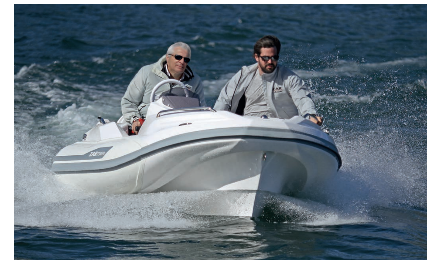
Le qualità idrodinamiche e progettuali della carena sono state studiate in modo approfondito per ottenere prestazioni di alto livello.