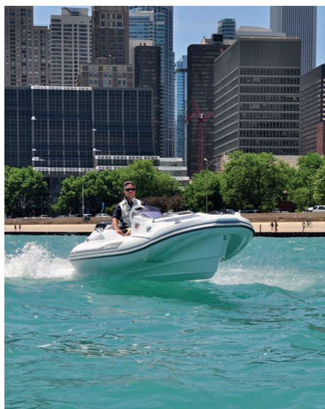
Classe, confort e divertimento... sull'acqua