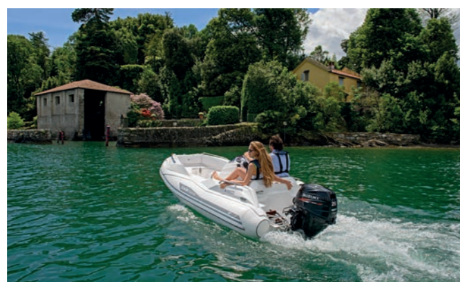
Style, comfort and fun... on the water