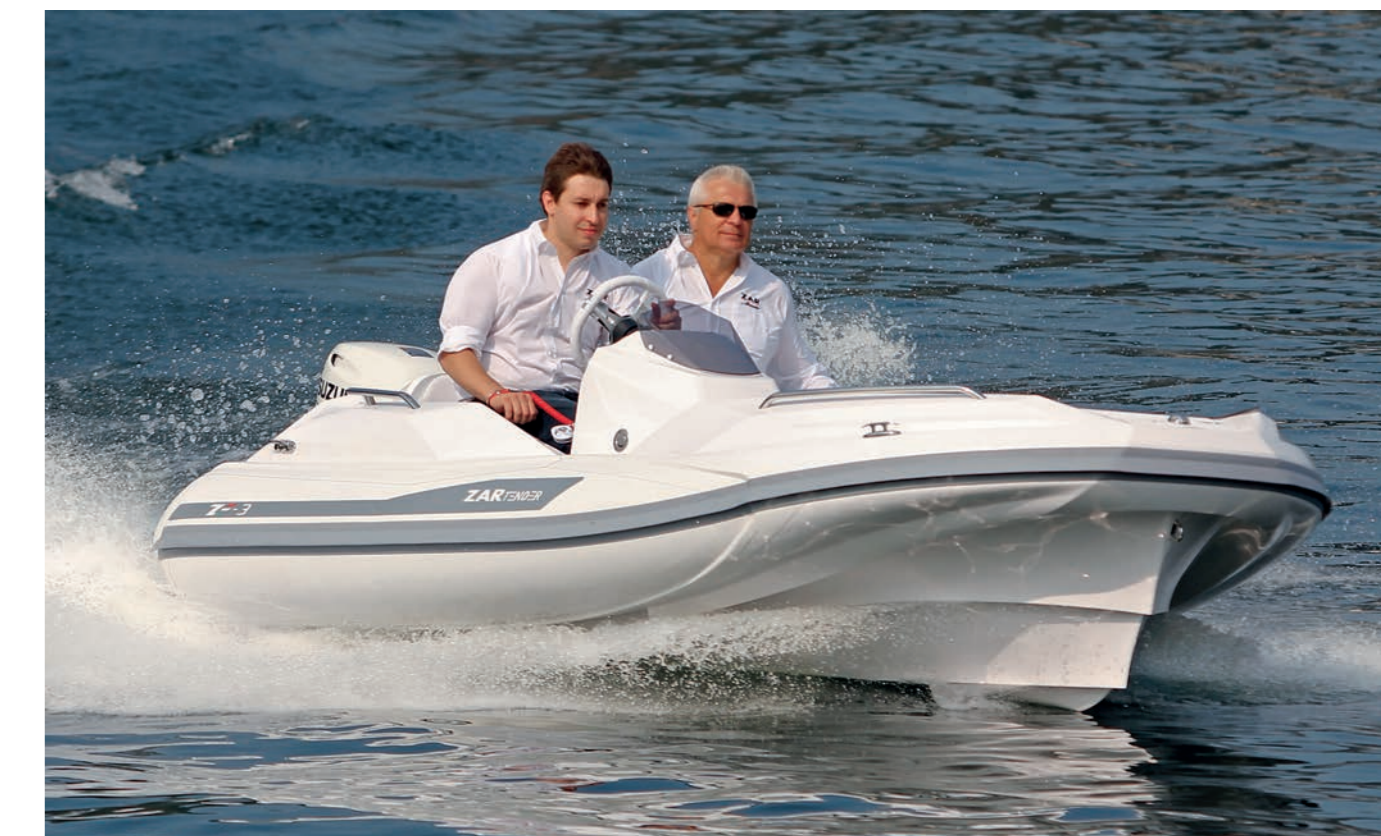
Il cantiere si riserva il diritto di apportare modifiche alle caratteristiche tecniche senza obbligo di preavviso. The manufacturer reserves the right to make any changes without any obligation to declare.