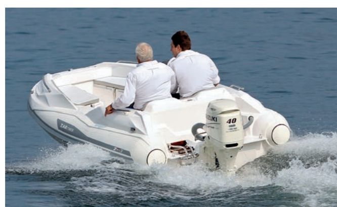
Il cantiere si riserva il diritto di apportare modifiche alle caratteristiche tecniche senza obbligo di preavviso. The manufacturer reserves the right to make any changes without any obligation to declare.